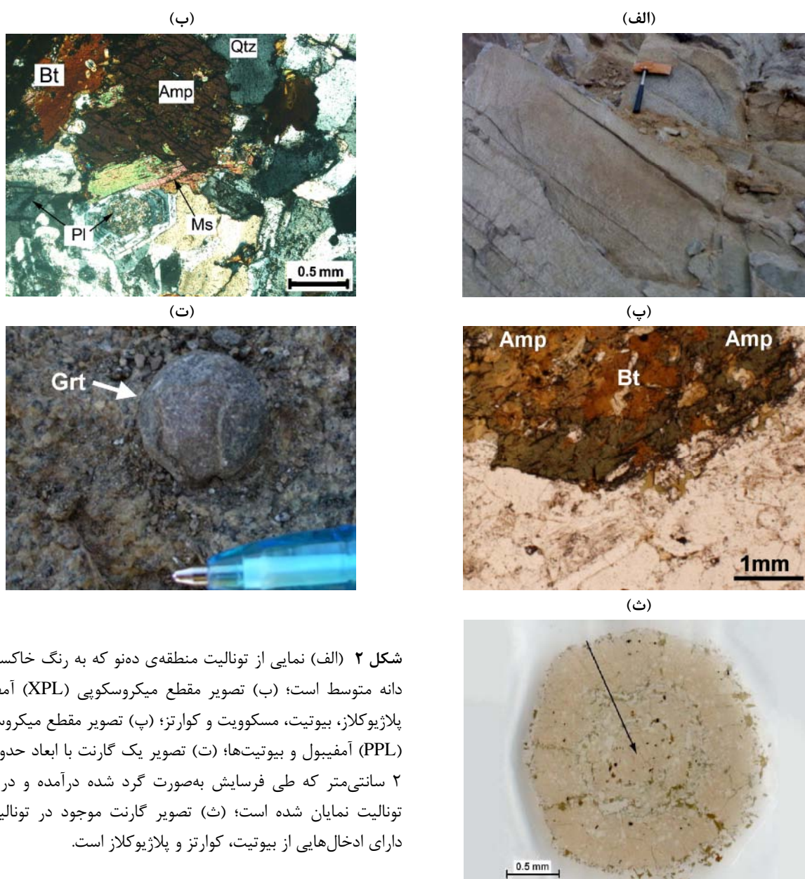
شکل ۲ (الف) نمایی از تونالیت منطقه‌ی دهنو که به رنگ خاکستری و دانه متوسط است؛ (ب) تصویر مقطع میکروسکوپی (XPL) آمفیبول، پلاژیوکلاز، بیوتیت، مسکوویت و کوارتز؛ (پ) تصویر مقطع میکروسکوپی (PPL) آمفیبول و بیوتیت‌ها؛ (ت) تصویر یک گارنت با ابعاد حدود ۱ تا ۲ سانتی‌متر که طی فرسایش به صورت گرد شده درآمده و در سطح تونالیت نمایان شده است؛ (ث) تصویر گارنت موجود در تونالیت که دارای ادخال‌هایی از بیوتیت، کوارتز و پلاژیوکلاز است.

پذیرفت (جدول ۲). بیوتیت‌ها در نمودار رده‌بندی میکاها (برگرفته از [۲۲]) بیشتر در گستره‌ی بین ترکیب آنیت تا سیدروفیلیت قرار می‌گیرند (شکل ۳-ب). فلدسپار: پلاژیوکلازها ۴۵ تا ۵۰ درصد سنگ را تشکیل می‌دهند و به صورت نیمه خودشکل تا خودشکل و دارای ماکل پریکلین و کارلسیادند (شکل ۲-ب). پلاژیوکلازها سوسوریتی شده‌اند و بیشترین دگرسانی در مرکز آنها صورت گرفته است. پلاژیوکلازها به صورت غالب با منطقه‌بندی نرمال تا نوسانی بوده (An 45-54 ) و بیشتر از نوع پلاژیوکلازهای آندزین-لابرادوریت هستند (شکل ۳-الف). نتایج آنالیز این کانی در جدول ۳ آورده